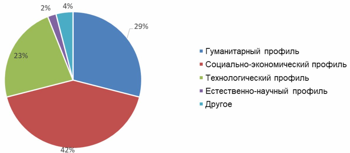
Профильное обучение по направлениям